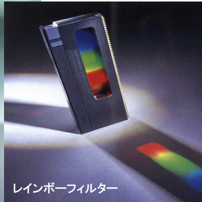
レインボーフィルター